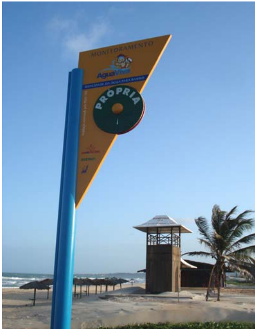
Fig. 03 – Fotografia da placa de sinalização das condições de balneabilidade na praia de Búzios (NF 03), no município de Nísia Floresta-RN, apresentando bom estado de conservação.

Placa em excelente estado de conservação, porém apresentando instabilidade na fixação ao terreno do seu poste de sustentação, com sério risco de tombamento (Figs. 03 e 04).