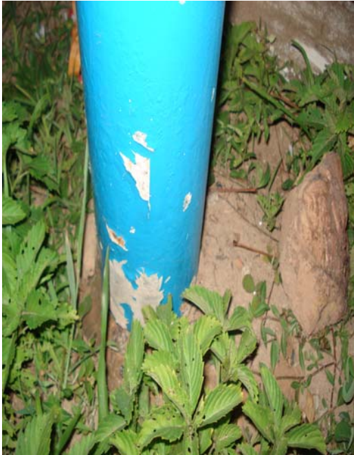
Fig. 12 – Detalhe do tubo de sustentação da placa de sinalização das condições de balneabilidade na praia de Cotovelo (PA 04), no município de Parnamirim-RN, mostrando danos na sua pintura.