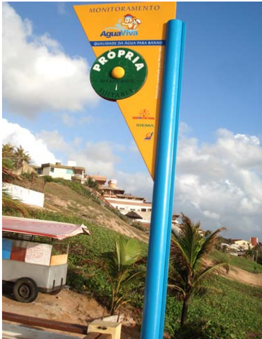
Fig. 21 – Fotografia da placa de sinalização das condições de balneabilidade, instalada na praia de Ponta Negra (Final do Calçadão) - NA 04), no município de Natal-RN.

Placa com pequenos danos na sua pintura, com riscos bem visíveis em seus discos de sinalização (Figs. 21 e 22).