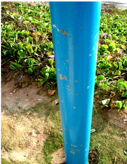
Fig. 22 – Detalhe do poste de sustentação da placa de sinalização das condições de balneabilidade da Praia de Ponta Negra (Final do Calçadão - NA 04), no município de Natal-RN, mostrando danos na sua pintura.