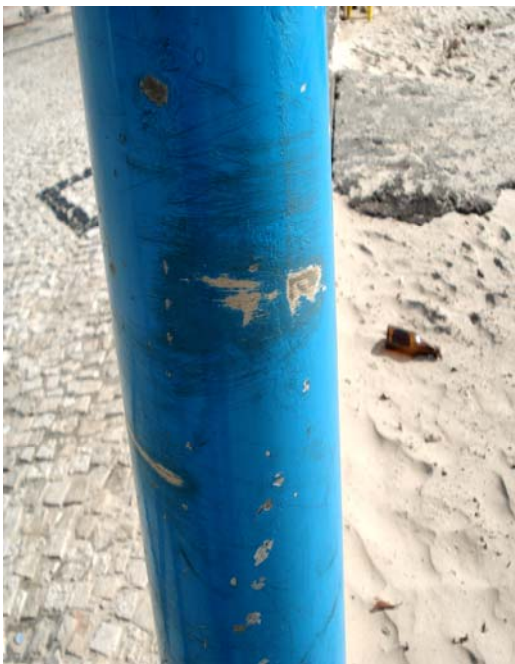
Fig. 36 – Detalhe do poste de sustentação da placa de sinalização das condições de balneabilidade na Praia da Redinha (Rio Potengi - NA 13), no município de Natal-RN, constatando-se danos na sua pintura.