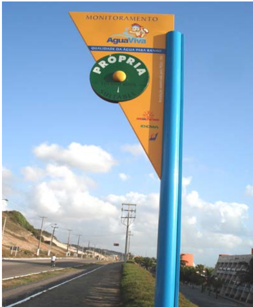
Fig. 23 – Fotografia da placa de sinalização das condições de balneabilidade, instalada na Via Costeira (Praia de Cacimba do Boi - NA 05), no município de Natal-RN.

Placa em excelente estado de conservação, não apresentando qualquer tipo de dano ou avaria (Fig. 23).