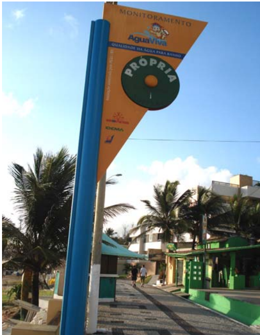
Fig. 19 – Fotografia da placa de sinalização das condições de balneabilidade, instalada na praia de Ponta Negra (Free Willy - NA 02), no município de Natal-RN.

Placa em bom estado de conservação, Identificando-se apenas pequenos arranhões na pintura do seu poste de sustentação (Figs. 19 e 20).