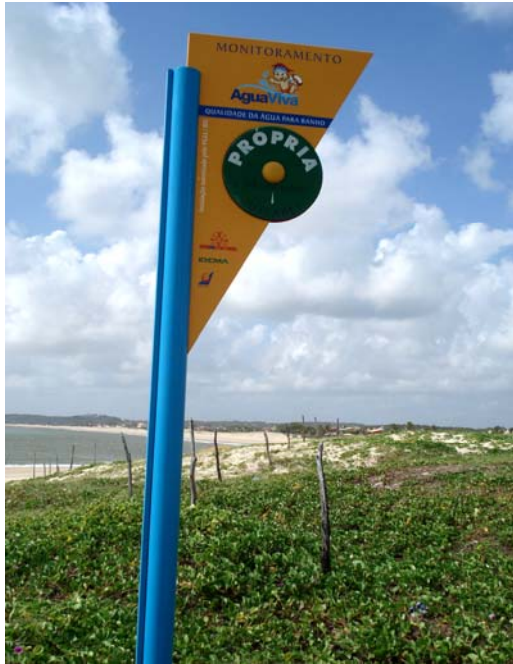
Fig. 43 – Fotografia da placa de sinalização das condições de balneabilidade, instalada na Praia de Graçandu (Barracas - EX 05), no município de Extremoz-RN.

Placa em excelente estado de conservação, não apresentando avaria significativa ( Fig. 43 ).