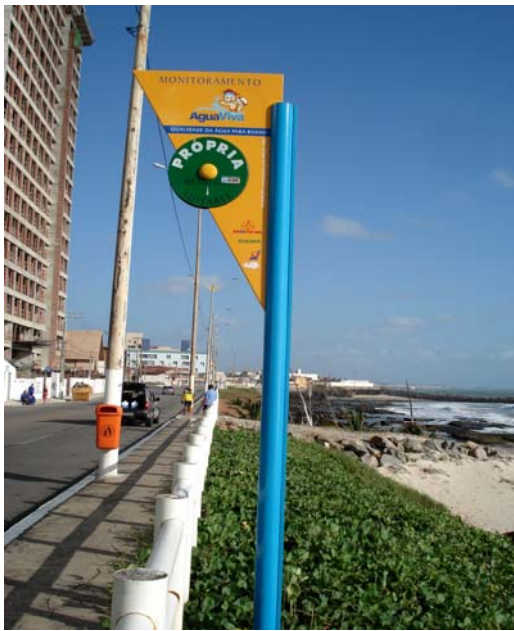
Fig. 29 – Fotografia da placa de sinalização das condições de balneabilidade, instalada na Praia de Areia Preta (NA 09), no município de Natal-RN.

Placa em excelente estado de conservação, não apresentando qualquer tipo de dano ou avaria ( Fig. 29 ).