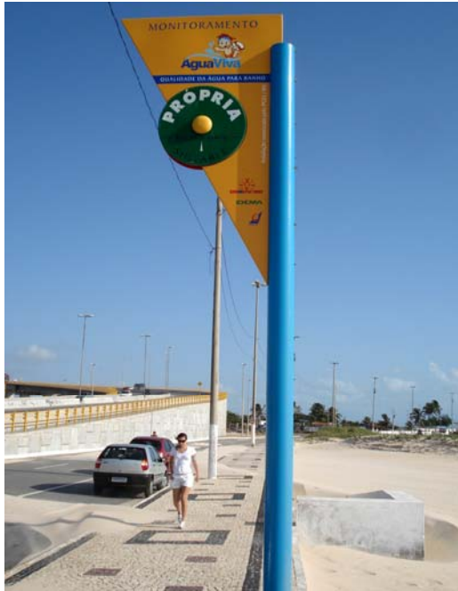
Fig. 33 – Fotografia da placa de sinalização das condições de balneabilidade, instalada na Praia do Forte (NA 12), no município de Natal-RN.

Mínimos danos em sua pintura e ausência do protetor de parafusos no poste de sustentação (Figs. 33 e 34).