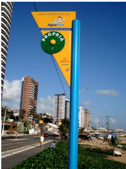
Fig. 28 – Fotografia da placa de sinalização das condições de balneabilidade, instalada na Praia de Miami (NA 08), no município de Natal-RN.

Placa em excelente estado de conservação, apresentando apenas pequenos danos em sua pintura ( Fig. 28 ).