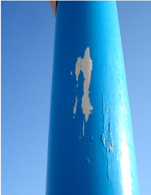
Fig. 27 – Detalhe do poste de sustentação da placa de sinalização das condições de balneabilidade na Praia de Mãe Luíza (NA 07), no município de Natal-RN, mostrando danos na sua pintura.