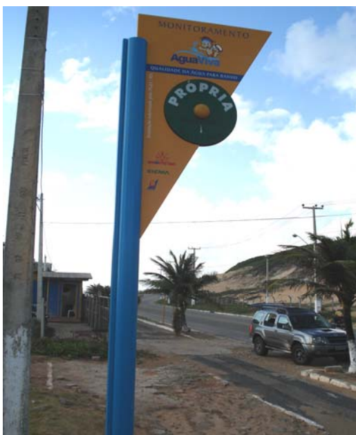
Fig. 24 – Fotografia da placa de sinalização das condições de balneabilidade, instalada na Via Costeira (Praia de Barreira D'Água - NA 06), no município de Natal-RN.

Placa em excelente estado de conservação. Não apresentando qualquer tipo de dano ou avaria (Fig. 24).