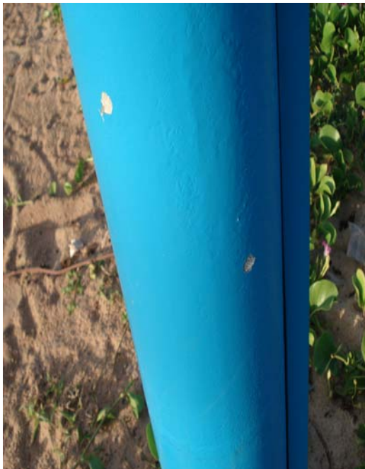
Fig. 02 – Detalhe do poste de sustentação da placa de sinalização das condições de balneabilidade na praia de Tabatinga (NF 02), no município de Nísia Floresta-RN, mostrando pequenos danos na pintura.

Placa em excelente estado de conservação, apresentando apenas pequenos danos na pintura, na parte inferior do seu poste de sustentação ( Fig. 02 ).