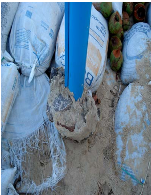
Fig. 04 – Fotografia do poste de sustentação da placa de sinalização das condições de balneabilidade, na praia de Búzios (NF 03), no município de Nísia Floresta-RN, observando-se a instabilidade deste, com sério risco de tombamento.