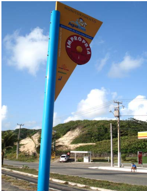
Fig. 25 – Fotografia da placa de sinalização das condições de balneabilidade, instalada na Via Costeira (Praia de Mãe Luíza - NA 07), no município de Natal-RN.

Placa apresentando pequenos danos em sua pintura e ausência do protetor de parafusos (Figs. 25, 26 e 27).