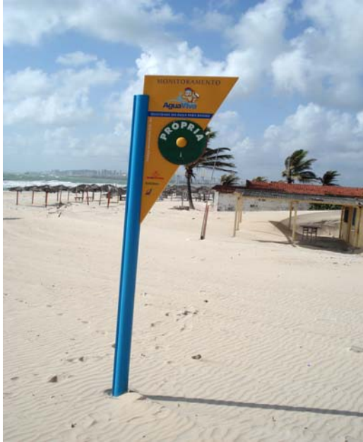
Fig. 38 – Fotografia da placa de sinalização das condições de balneabilidade, instalada na Praia da Redinha (Tômbolo - EX 02), no município de Extremoz-RN.

Placa em excelente estado de conservação, não se constatando nenhuma avaria significativa ( Fig. 38 ).