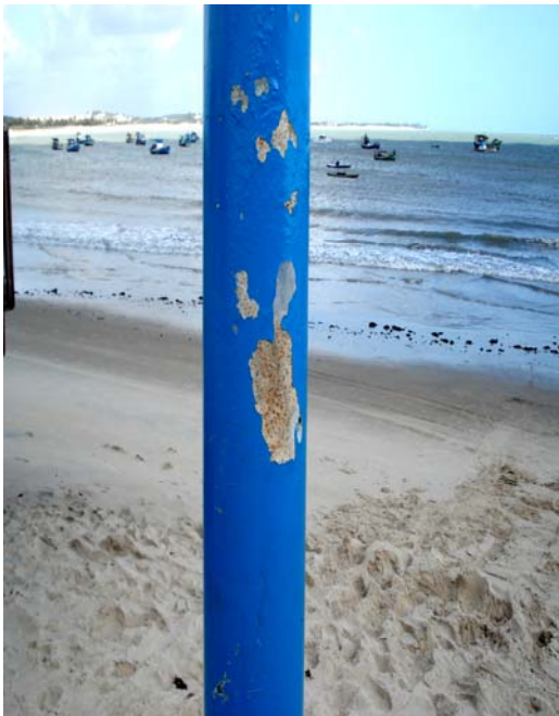
Fig. 45 – Detalhe do poste de sustentação da placa de sinalização das condições de balneabilidade na Praia de Pitangui (EX 06), no município de Extremoz-RN, constatando-se danos severos na sua pintura.