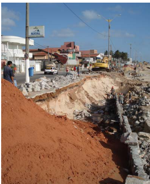
Fig. 30 – Fotografia mostrando obras de recuperação do calçadão na Praia dos Artistas, no município de Natal-RN, no local onde se encontrava fincada a placa de sinalização das condições de balneabilidade da praia.

Placa não localizada. Possivelmente retirada em função das obras de recuperação do calçadão ( Fig. 30 ).