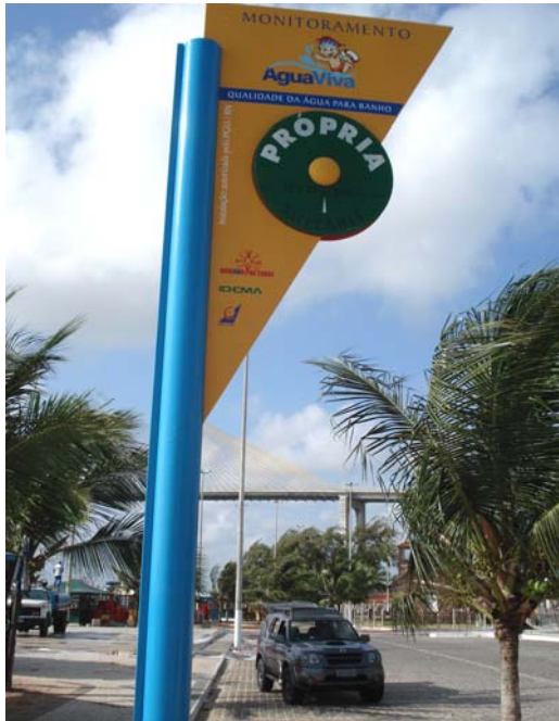
Fig. 37 – Fotografia da placa de sinalização das condições de balneabilidade, instalada na Praia da Redinha (Igreja - NA 14), no município de Natal-RN.

Esta placa se encontra em ótimo estado de conservação ( Fig. 37 ).