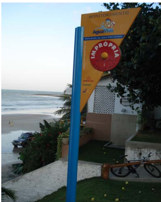
Fig. 06 – Fotografia da placa de sinalização das condições de balneabilidade na praia de Pirangi do Sul (NF 05), no município de Nísia Floresta-RN.

Placa em bom estado de conservação, apresentando apenas pequenos danos na pintura no seu tubo de sustentação (Figs. 06 e 07).