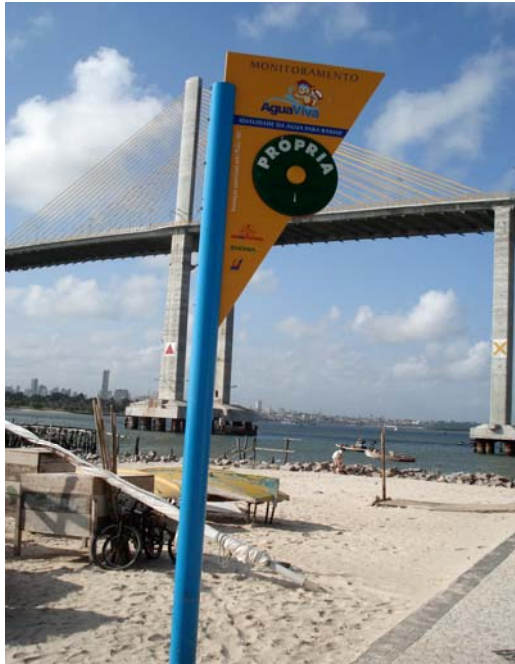
Fig. 35 – Fotografia da placa de sinalização das condições de balneabilidade, instalada na Praia da Redinha (Rio Potengi - NA 12), no município de Natal-RN.

Constataram-se danos na pintura e a ausência do protetor de parafusos no poste de sustentação (Figs. 35 e 36).