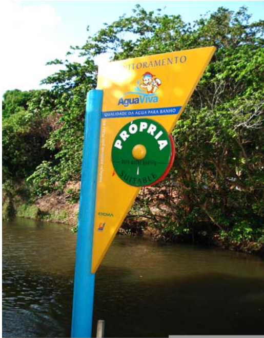
Fig. 13 – Fotografia da placa de sinalização das condições de balneabilidade, instalada no Balneário do rio Pium (PA 05), no município de Parnamirim-RN.