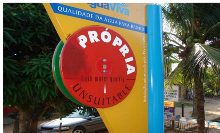
Fig. 14 – Detalhe do disco de sinalização das condições de balneabilidade no Balneário do rio Pium - PA 05 (município de Parnamirim-RN), observando-se a adulteração criminosa desta sinalização.