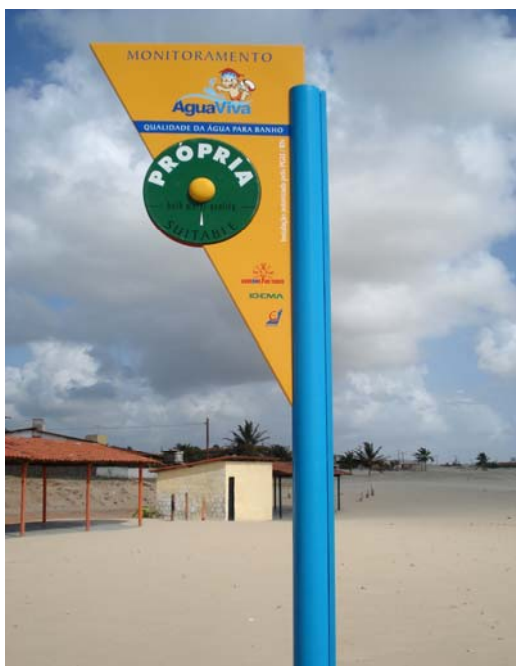
Fig. 41 – Fotografia da placa de sinalização das condições de balneabilidade, instalada na Praia de Barra do Rio (Cata-vento - EX 04), no município de Extremoz-RN.

Placa em bom estado de conservação, observando-se apenas pequenas avarias na pintura do seu poste de sustentação (Figs. 41 e 42).