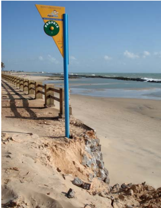
Fig. 31 – Fotografia da placa de sinalização das condições de balneabilidade, instalada na Praia do Meio (Iemanjá - NA 11), no município de Natal-RN, com risco iminente de tombamento.

Placa com mínimos danos em sua pintura, constatando-se a ausência de parte do protetor de parafusos e a necessidade urgente da sua relocação, face ao risco iminente de tombamento, devido à erosão da linha de costa ( Figs. 31 e 32 ).