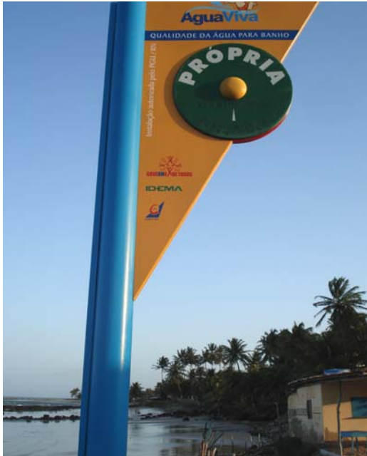
Fig. 05 – Fotografia da placa de sinalização das condições de balneabilidade na praia de Búzios - Barracas (NF 04), no município de Nísia Floresta-RN, sem danos aparentes.

Placa em bom estado de conservação, sem danos aparentes (Fig. 05).