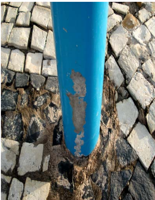
Fig. 18 – Detalhe do poste de sustentação da placa de sinalização das condições de balneabilidade da Praia de Ponta Negra (acesso principal - NA 02), no município de Natal-RN, mostrando danos na sua pintura.