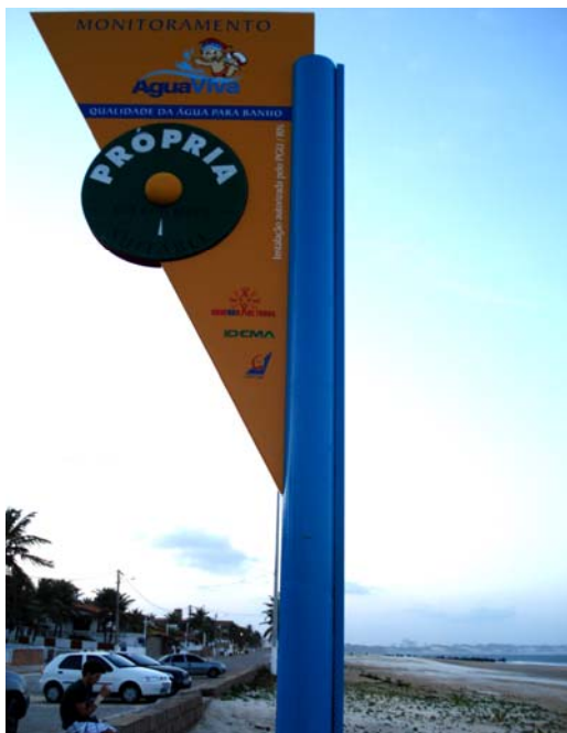
Fig. 09 – Fotografia da placa de sinalização das condições de balneabilidade na praia de Pirangi do Norte - Coqueiros (PA 03), no município de Parnamirim-RN.

Placa em bom estado de conservação, apresentando mínimas avarias na pintura do seu tubo de sustentação (Figs 09 e 10).