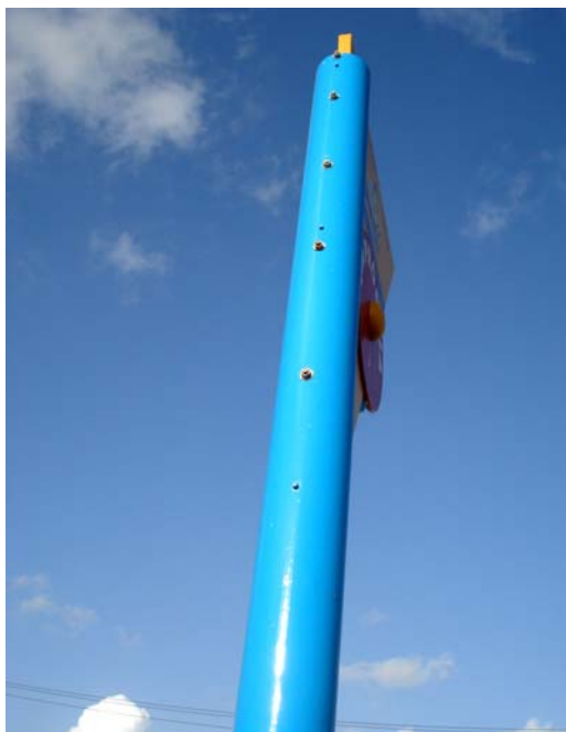
Fig. 26 – Detalhe do poste de sustentação da placa de sinalização das condições de balneabilidade na Praia de Mãe Luiz (NA 07), no município de Natal-RN, onde se pode constatar a ausência do protetor dos parafusos.