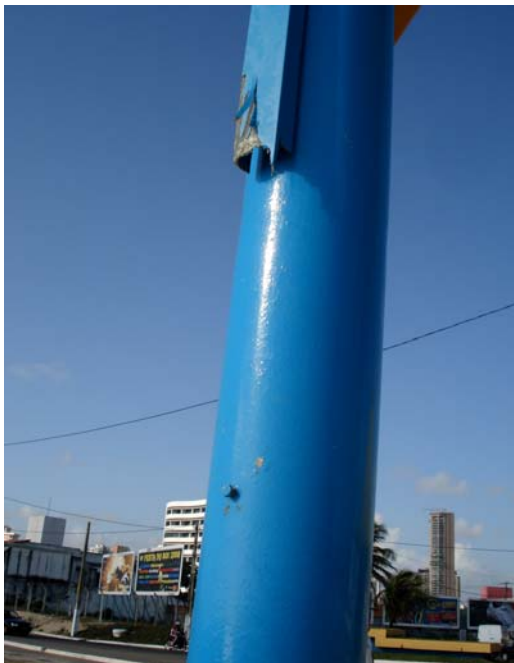
Fig. 32 – Detalhe do poste de sustentação da placa de sinalização das condições de balneabilidade na Praia do Meio (NA 11), no município de Natal-RN, constatando-se a ausência de parte do protetor dos parafusos.