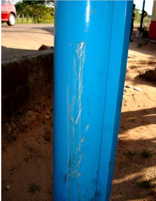
Fig. 15 – Detalhe do poste de sustentação da placa de sinalização das condições de balneabilidade no Balneário do rio Pium (PA 05), no município de Parnamirim-RN, mostrando danos na sua pintura.