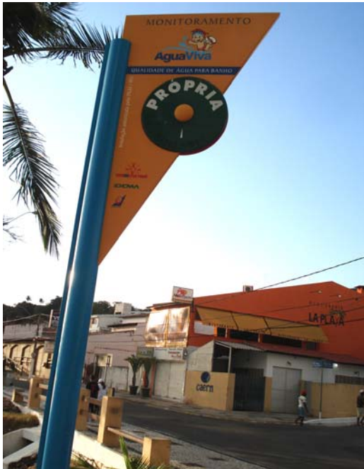
Fig. 17 – Fotografia da placa de sinalização das condições de balneabilidade, instalada na praia de Ponta Negra (acesso principal - NA 02), no município de Natal-RN.

Placa em bom estado de conservação, Identificando-se apenas pequenos arranhões na pintura do seu poste de sustentação (Figs. 17 e 18).