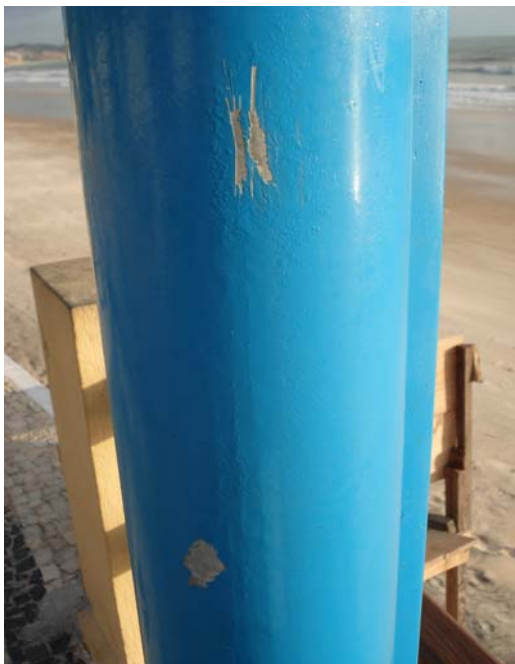
Fig. 20 – Detalhe do poste de sustentação da placa de sinalização das condições de balneabilidade da Praia de Ponta Negra (Free Willy - NA 03), no município de Natal-RN, mostrando danos na sua pintura.