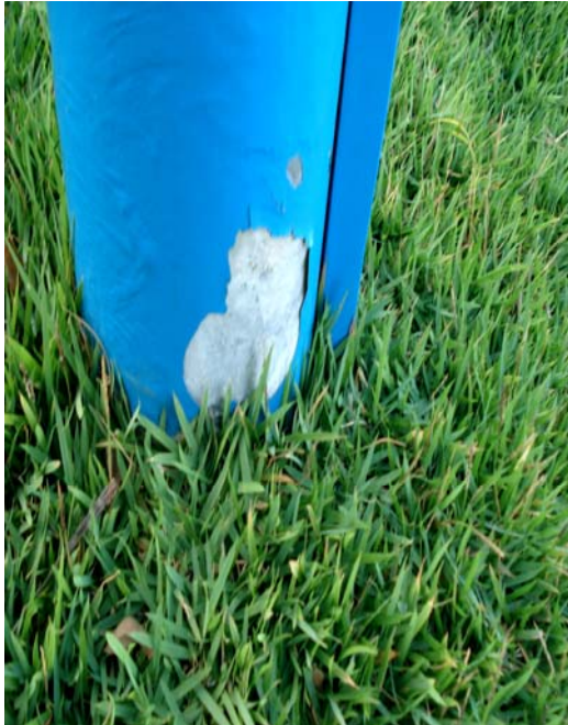
Fig. 07 – Detalhe do tubo de sustentação da placa de sinalização das condições de balneabilidade na praia de Pirangi do Sul – Igreja (NF 05), no município de Nísia Floresta-RN, mostrando pequenos danos na sua pintura.