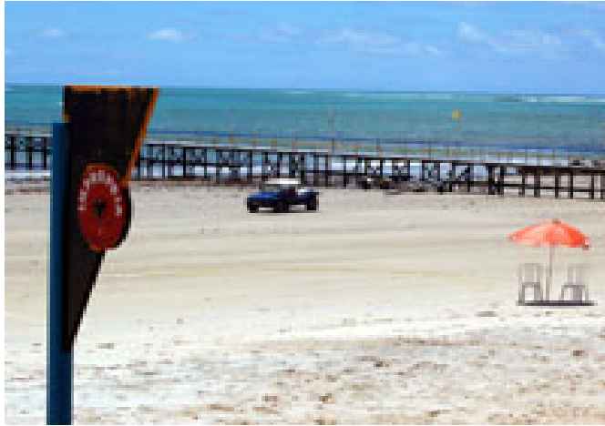
Fig. 08 – Fotografia mostrando a Placa de sinalização em Pirangi do Norte – APURN pichada.