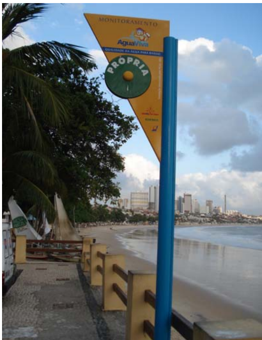
Fig. 16 – Fotografia da placa de sinalização das condições de balneabilidade, instalada na praia de Ponta Negra (Morro do Careca - NA 01), no município de Natal-RN.

Placa em excelente estado de conservação, não apresentando nenhum tipo de dano ou avaria ( Fig. 16 ).