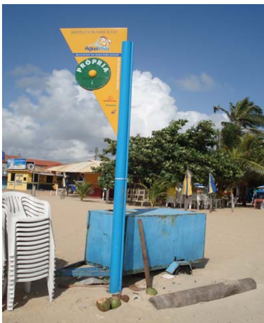
Fig. 39 – Fotografia da placa de sinalização das condições de balneabilidade, instalada na Praia de Jenipabu (Barracas - EX 02), no município de Extremoz-RN.

Placa em excelente estado de conservação, não se constatando nenhuma avaria significativa ( Fig. 39 ).