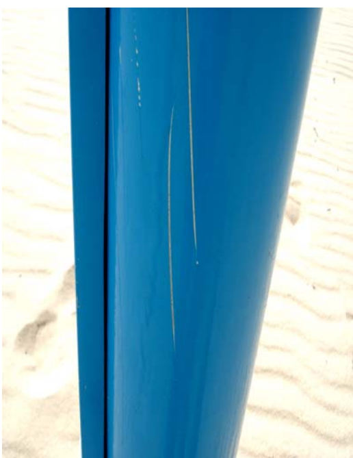
Fig. 42 – Detalhe do poste de sustentação da placa de sinalização das condições de balneabilidade na Praia de Barra do Rio (Cata-vento - EX 04), no município de Extremoz-RN, contatando-se apenas pequenos arranhões na sua pintura.