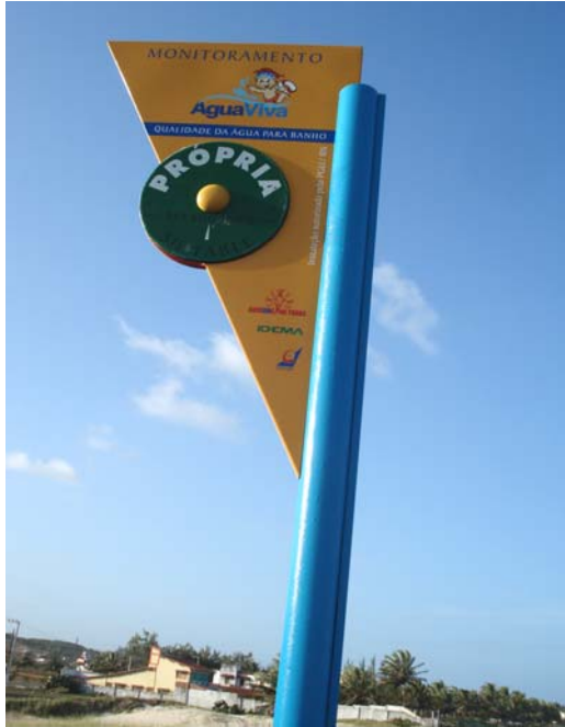
Fig. 01 – Fotografia da placa de sinalização das condições de balneabilidade na praia de Tabatinga (NF 01), no município de Nísia Floresta-RN.