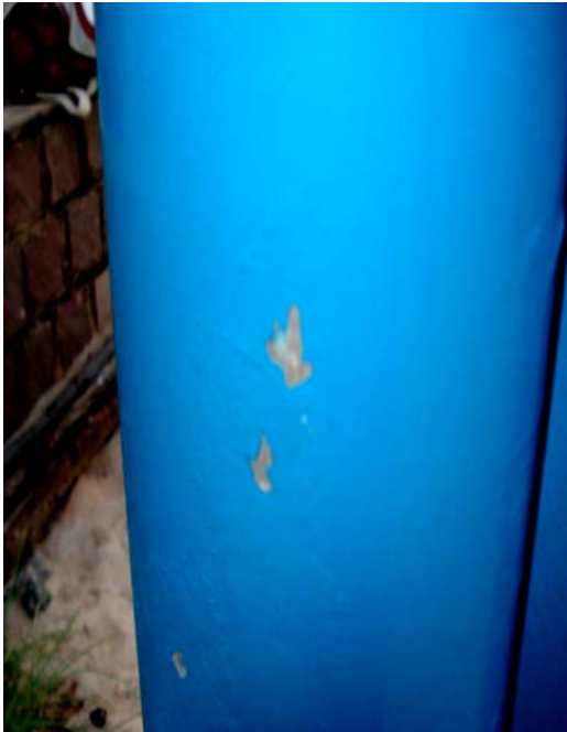
Fig. 10 – Detalhe do poste de sustentação da placa de sinalização das condições de balneabilidade na praia de Pirangi do Norte – Coqueiros (PA 03), no município de Parnamirim-RN, mostrando pequenos danos na sua pintura.