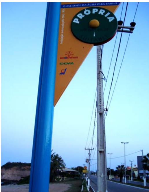
Fig. 11 – Fotografia da placa de sinalização das condições de balneabilidade na praia de Cotovelo (PA 04), no município de Parnamirim-RN.

Placa em bom estado de conservação, apenas apresentando danos na pintura do seu poste de sustentação ( Figs. 11 e 12 ).